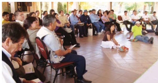
Lanzamiento del CAP 3 en Cochabamba, Bolivia, en 2010.