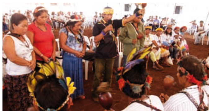
Encuentro de los Pueblos Guaranis, Tecoha Añetete, Brasil, en 2010.