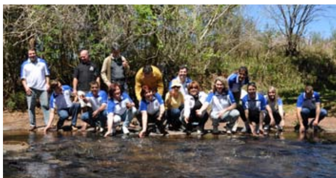
Segundo proceso formativo CAP3 en Matelandia (Brasil), en septiembre de 2010.