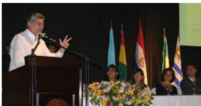
Diálogos sobre Educación Socioambiental en la Universidad Nacional de Asunción, Paraguay, en 2008.