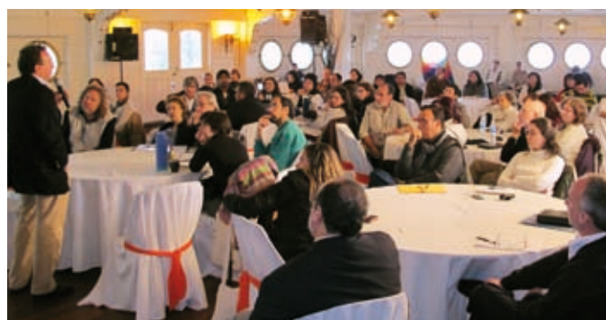
Encuentro de los CAPs en La Plata, Argentina, en 2010.