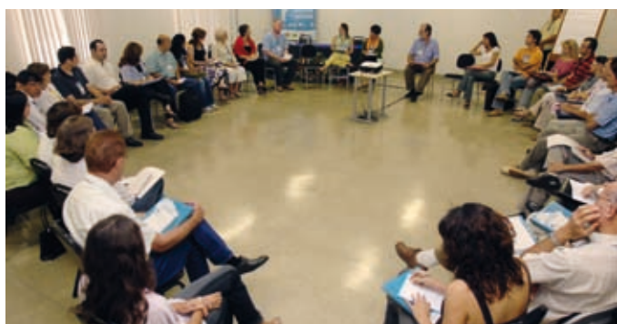
Diálogos sobre Economía Ecológica y Ecología Política, en el Parque Tecnológico Itaipu, Foz do Iguaçu, Brasil, en 2008.