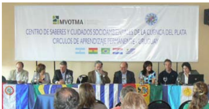
Lanzamiento del proceso CAP3 en Uruguay, en octubre de 2010.