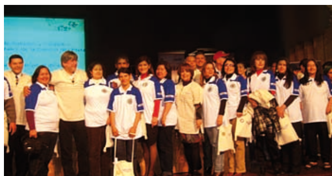
Lanzamiento del CAP 3 en Asunción, Paraguay, en 2010.